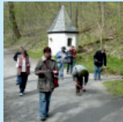
Teilnehmer beim Wunschschulergang

Weitere Informationen und Termine finden Sie in meiner Homepage unter „Veranstaltungen“ oder können direkt bei mir erfragt werden.