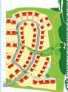
Entwurf der Feng Shui- und Geomantieberatung Dorimund Raum

Ziel ist für die vorhandenen Ortsqualitäten die energetisch optimalen Gestaltungsempfehlungen festzustellen, um auch dem Menschen wieder eine größere Verbundenheit zu dem göttlichen All-Einssein zu ermöglichen.